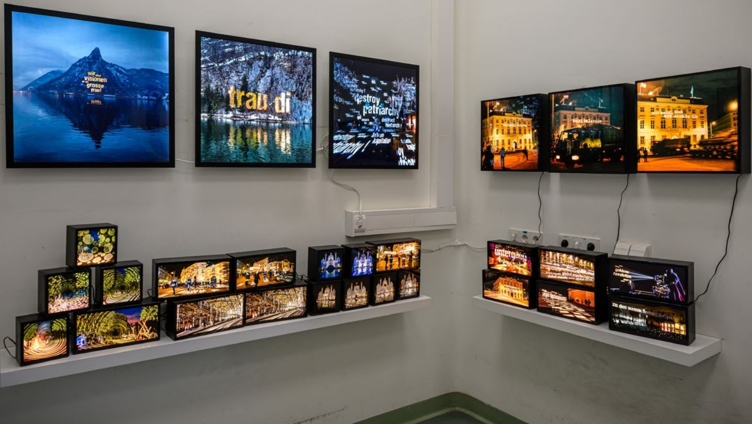
leuchtbilder und Luxomaten | Parallel Vienna 2024 | art : starsky | foto : osaka | Otto Wagner Spital, Wien | 2024