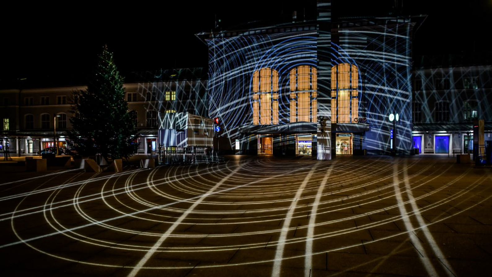
Wohin - eine subjektive | LICHTBLICKE | section a | Hauptbahnhof Salzburg, 2017 | Installation : starsky